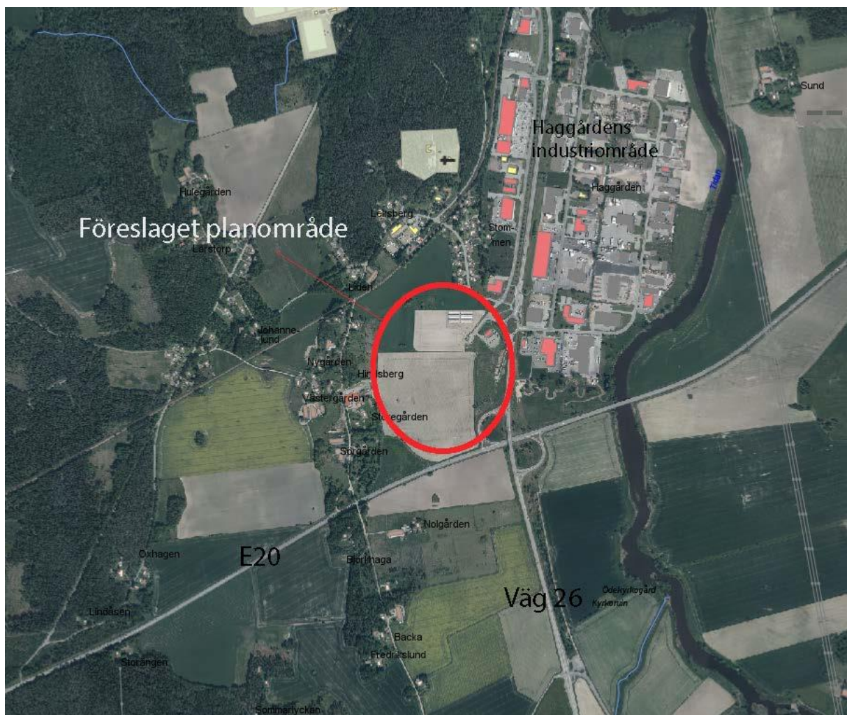
Figur 1. Översiktskarta med planområdets lokalisering

Behovsbedömningen genomförs genom en checklista. Checklistan ska ge en helhetsbild av effekterna av en detaljplan. Utgångspunkten är bilaga 2 och 4 till förordning om MKB (1998:905). Checklistan ger kunskap om vilka frågor som berörs samt vilka frågor som innebär risk för betydande miljöpåverkan för aktuell detaljplan. Avslutningsvis sker en sammanvägd bedömning av de frågeställningar som bedömts medföra risk för betydande miljöpåverkan. Checklistan inkluderar skyddsvärden, effekter på miljön samt effekter på hälsa och säkerhet.