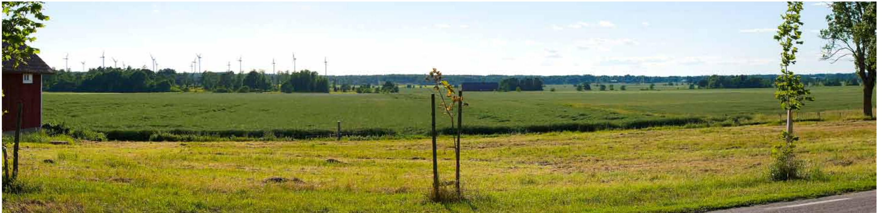
Område J – ca 30 verk placerade i skogsområdet mellan Björsäter och Årnäs, sett österifrån från Björsäter över den öppna jordbruksmarken söder om Mariestadssjön. Vindkraftverken ses här på ett avstånd av 3-6 km, och i denna vy skymms den södra delen av gruppen. Påverkan på landskapsbilden bedöms bli måttlig då gruppen är väl samlad och endast påverkar en mindre del av den totala vyn i det öppna landskapet.