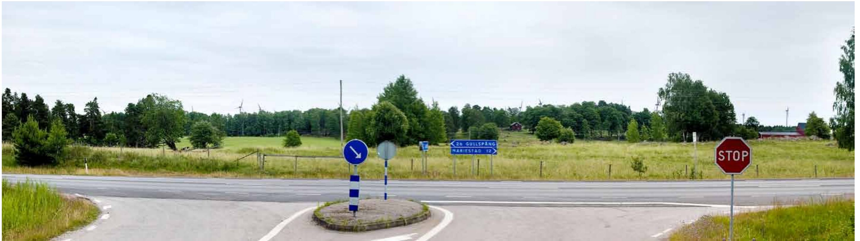
Område G – ca 35 verk sett västerifrån vid Fåleberg över väg 26, strax norr om Hassle. Vindkraftverken ses här på ett avstånd av 3-7 km. Vegetation i jordbrukslandskapet skymmer till stor del verken vilket gör att påverkan på landskapsbilden blir liten. Från väg E20 som går bara 1 km från det föreslagna området syns än mindre av verken p g a skog. Verken blir dock mer synliga från väg 26 i det öppna jordbrukslandskapet mellan Fåleberg och Hassle.