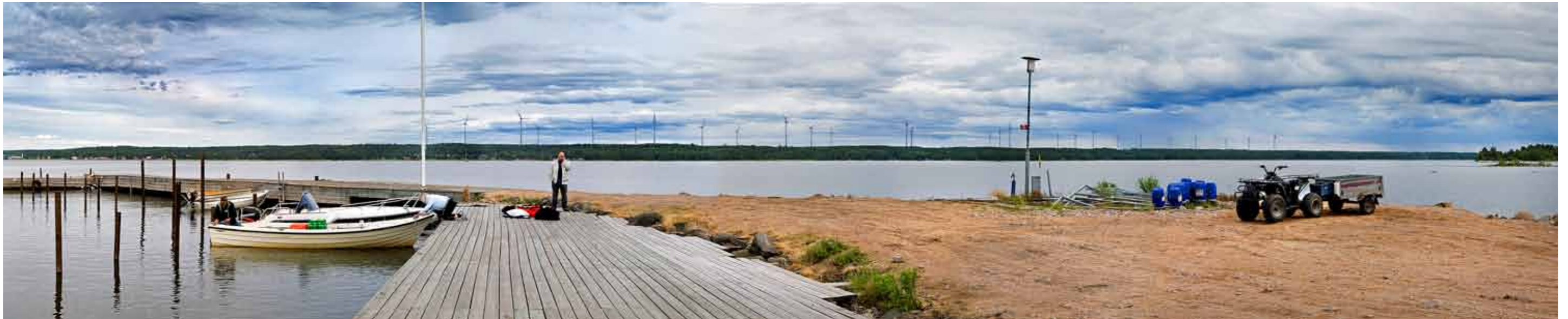
Område B – ca 25–30 verk sett från väster från Storön mot Otterbäcken. Vindkraftverken ses här på ett avstånd av 3–7 km. Avståndet gör att de enskilda verken ej blir dominerande i vyn. Trots detta påverkas vyn påtagligt genom att de vindkraftverken står i ett smalt stråk med två rader vindkraftverk vilket gör att i stort sett hela vyn mot land påverkas av verken.