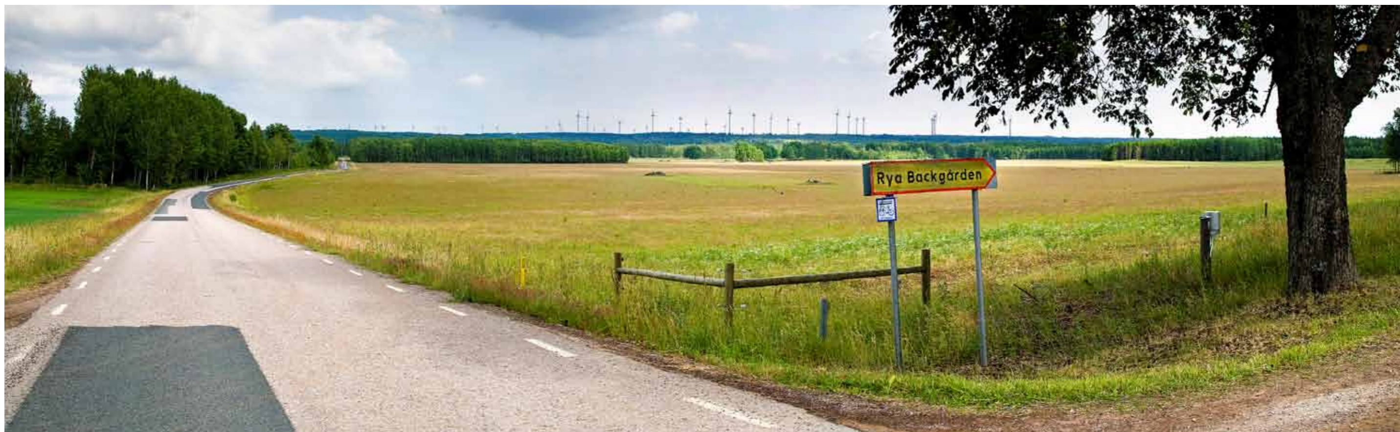
Område M/O – ca 35 verk sedda från väster vid infarten till Rydholms gård. Vindkraftverken ses här på ett avstånd av cirka 4–9 km och upplevs som en enda stor grupp. Avståndet gör att de enskilda verken ej blir dominerande i vyn. Trots detta påverkas vyn påtagligt genom det stora antalet verk som till stor del sticker upp i horisontlinjen över Vikaskogen.