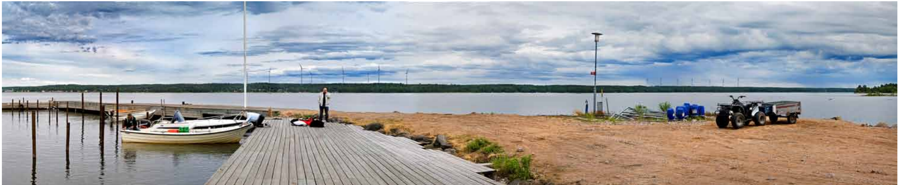
Samma vy som ovan men med placering av verken i två grupper om ca 8 stycken vardera.