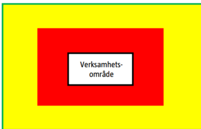
Figur 1. Illustration över riskhanteringsavståndet och tänkt användning för verksamheter som hanterar brandfarliga gaser, brandfarliga vätskor och oxiderande ämnen. Den gröna linjen representerar den yttre gränsen för riskhanteringsavståndet. Olyckor inom verksamheten förväntas ej kunna medföra personskador bortanför grön linje. Vid planläggning inom den gula zonen befinner man sig inom riskhanteringsavståndet vilket kräver att vidare analyser genomförs för att avgöra om tilltänkt markanvändning är lämplig. Den röda zonen är normalt olämplig att använda för markanvändning som medför stadigvarande vistelse i området [2].

Röd Zon – zon där ingen markanvändning som innebär annat än tillfällig vistelse kan tillåtas i normalfallet.