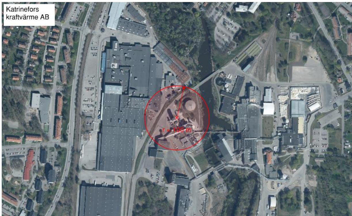
Figur 6. Kartillustration av riskhanteringsavståndet om 100 m för Katrinefors kraftvärme AB.

Med hänsyn till föregående bedöms cisternbrand bli dimensionerande för verksamhetens riskhanteringsavstånd. Baserat på erfarenhet från tidigare riskbedömning [23] bedöms risken för allvarliga personskador vara försumbar bortom 100 meter. Ett cirkulärt riskhanteringsavstånd om 100 meter föreslås för Katrinefors Kraftvärme, med utgångspunkt i centrum av cisternen, se Figur 6.