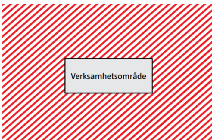
Figur 2. Illustration som visar schabloniserade riskhanteringsavstånd som i vägledningen har angetts som "större än", vilket representeras med en snedstreckad röd zon från fastighetsgräns. Detta gäller för verksamheter som hanterar explosiva varor, giftiga gaser, giftiga ämnen och frätande ämnen. För denna typ av verksamheter bör risken för dödsfall och skada beaktas till angivet riskhanteringsavstånd. I dessa situationer är det särskilt relevant att ta fram ett verksamhetsanpassat riskhanteringsavstånd [2].

Röd zon (snedstreckad) – zon för riskhanteringsavstånd, där risk för dödsfall och allvarlig skada kan inträffa. Används som underlag till ÖP och DP.