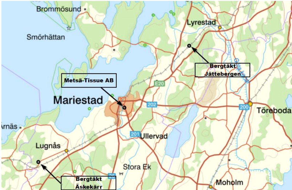
Figur 4. Sevesoverksamheter i Mariestads kommun.