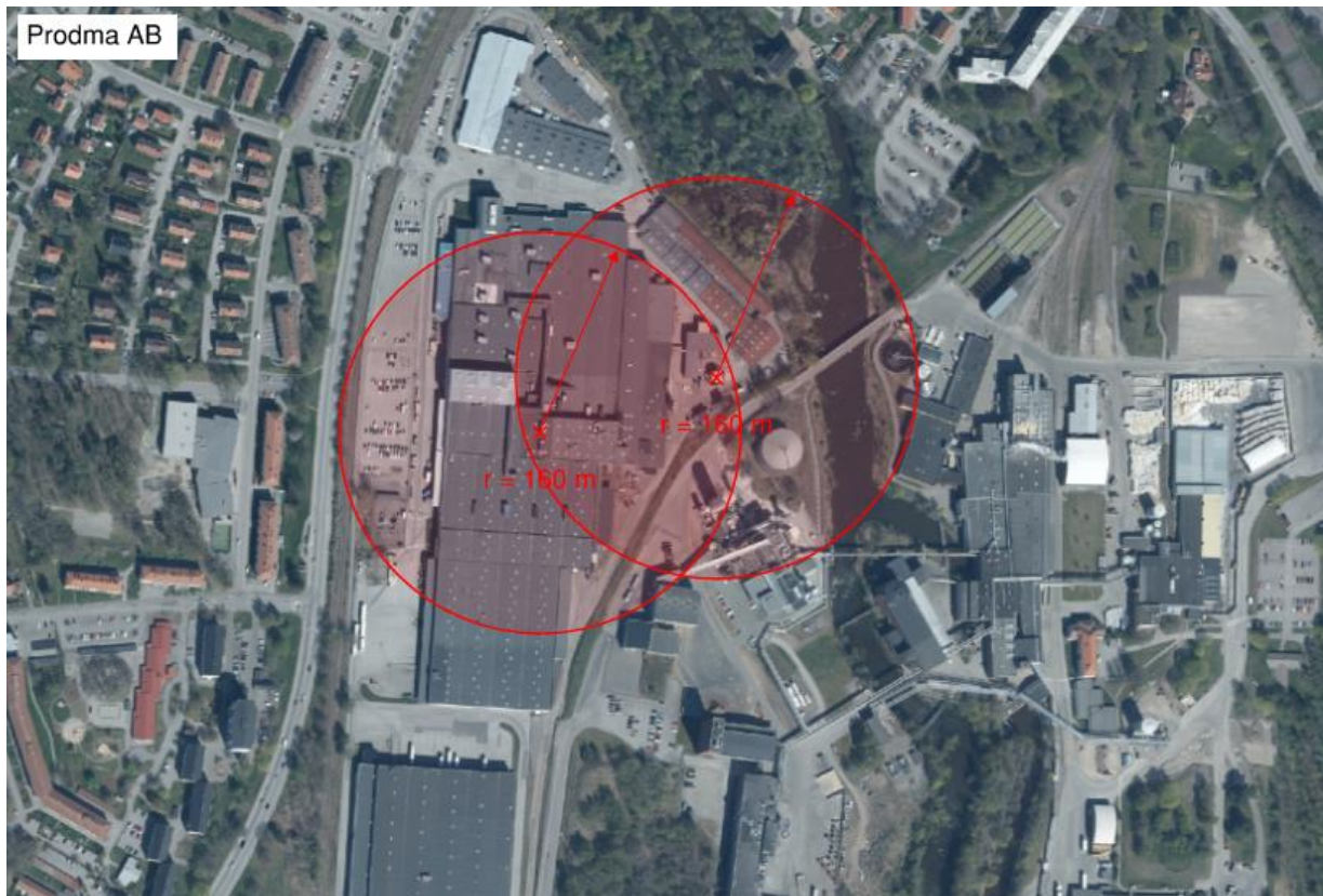
Figur 9. Kartillustration av riskhanteringsavstånden om 160 m vardera för Prodma AB.

Verksamhetens hantering av 78 620 liter gas överskrider det ansatta gränsvärdet om 4000 liter och således tas ett riskhanteringsavstånd fram i enlighet med Tabell 2 i MSB [1] där lagerförd mängd viktas mot mängderna i tabellen. Viktningen har gjorts med hänsyn till riskområde för potentiellt dödliga skadeeffekter till följd av olycka. Ett cirkulärt riskhanteringsavstånd föreslås om 160 meter för verksamheten med utgångspunkt från centrum av lagringstanken utomhus, samt ett lika stort riskhanteringsavstånd med utgångspunkt i centrum av byggnaden, se Figur 9. Två cirkulära riskhanteringsavstånd etableras eftersom brandfarlig gas lagras både inne i byggnaden och utomhus i en cistern på fastigheten.