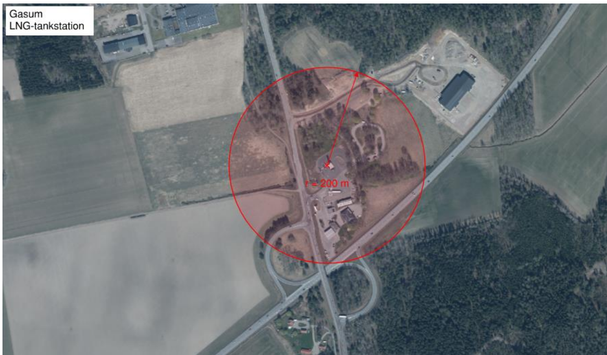
Figur 8. Kartillustration av riskhanteringsavståndet om 200 m för Gasum LNG-tankstation.

Verksamheten med sin hantering av 89 000 liter gas, hamnar över det ansatta gränsvärdet om 4 000 liter. En tidigare riskutredning för verksamheten [26] innehåller inga uttryckliga konsekvensmodelleringar varvid detta underlag ej kan användas för att etablera ett riskhanteringsavstånd. Ett riskhanteringsavstånd etableras i enlighet med rekommendationer enligt Tabell 2 i MSB:s vägledning [1] där lagerförd mängd viktas mot mängderna i tabellen. Viktningen har gjorts med hänsyn till riskområde för potentiellt dödliga skadeeffekter till följd av olycka. Ett cirkulärt riskhanteringsavstånd om 200 meter föreslås för verksamheten med utgångspunkt från centrum av lagringstanken, se Figur 8.