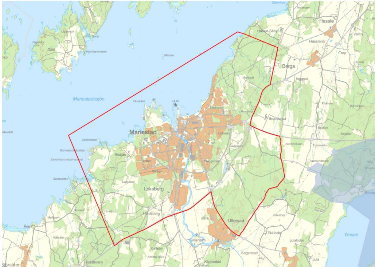
Figur 3. Utredningsområdet för Mariestads FÖP 2040. Bild från underlag till FÖP [4].

Det aktuella utredningsområdet avser en fördjupad översiktsplan för Mariestads tätort (Mariestad FÖP 2040), beläget i Mariestads kommun, se Figur 3.