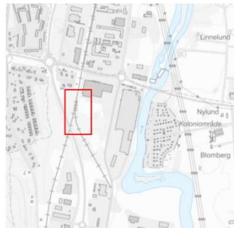
Karta 3. Södra delen av driftplats Mariestad. Spår "Kommun", och sky.spår markerade.