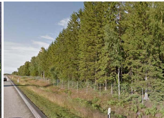
Yngre granskog utmed E20