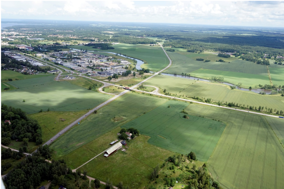
Odlingslandskap vid Tidan

Landskapet som omger Tidan söder om Mariestad utgörs av ett mycket flackt och storskaligt odlingslandskap. Utblickarna från vägen är storslagna utmed hela sträckan mellan trafikplats Haggården och trafikplats Sandbacken.