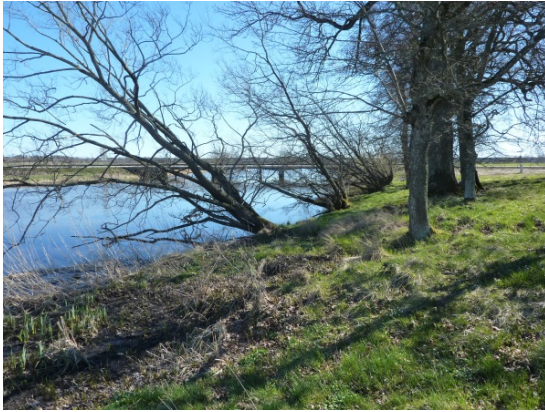
Tidan vid E20