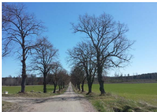
Alléer vid Ingarud och Tjos