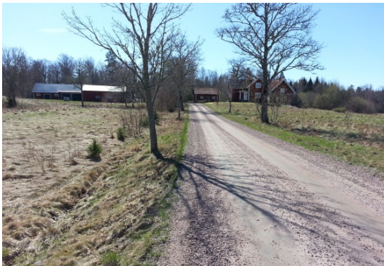
Vid gården Korstorp