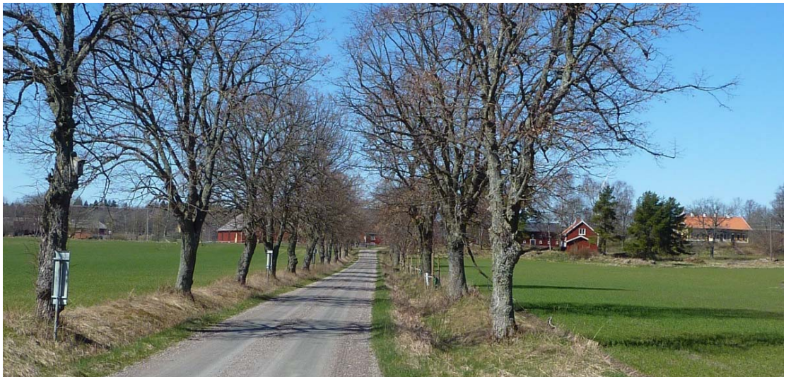
Vy mot Tjos

Området kring Hassle kyrkby är en kulturmiljö av kommunalt intresse. Här finns kyrka med omgivande bebyggelse som prästgård och enskilda gårdar. Området begränsas i öster av Hasslebäcken och i söder av järnvägen mellan Mariestad-Hallsberg. Bebyggelsen ligger samlad norr om kyrkan längs en av de höjdsträckningar, som är så karakteristiska för landskapet. Nedanför åsen i väster och öster utbreder sig vidsträckt och öppen jordbruksmark. Längs med åsen löper den gamla vägsträckningen mot Kristinehamn. Nollhassel by med den stora vita sockenkyrkan avtecknar sig på långt avstånd som ett tydligt landmärke i det omgivande slättområdet.