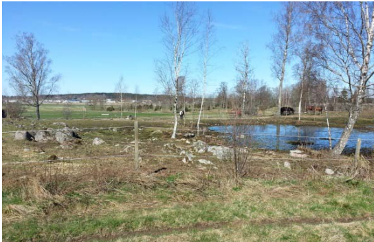
Vid ridanläggningen Brunnsberg