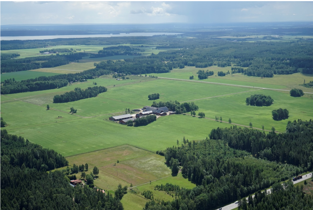
Vy mot söder över Brodderudsslätten