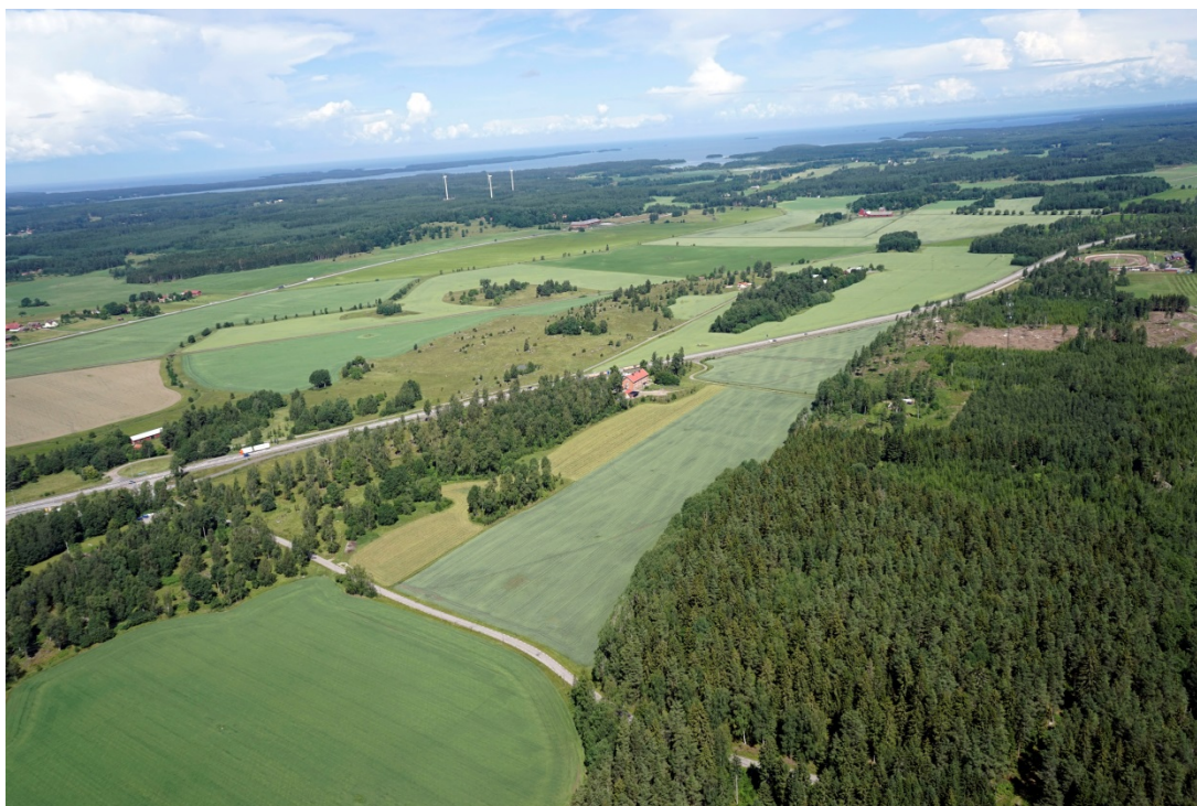
Betesmarker vid Greby-Vallby

Vid Greby och Vallby har på höjdryggen funnits byar under medeltiden. Här finns flera bevarade äldre landskapsstrukturer. Ett flertal fornlämningar finns på åsryggen, bl.a. ett större gravfält med högar och stensättningar samt en by- eller gårdstomt, odlingsterrasser och odlingsrösen.