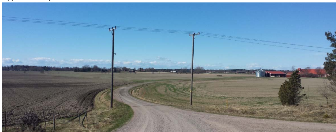
Vy över Hassleslätten