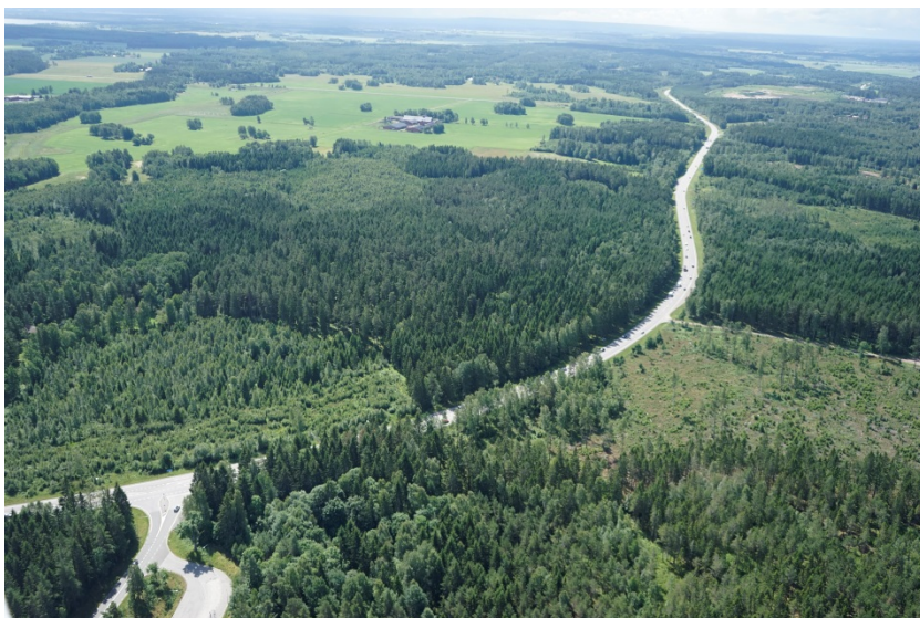
Slutet skogslandskap inom utredningsområdet norr om Brodderud

Det slutna skogslandskapet har generellt en högre tålighet mot ingrepp som t ex vägutbyggnad då ingreppen inte exponeras mot ett större område.