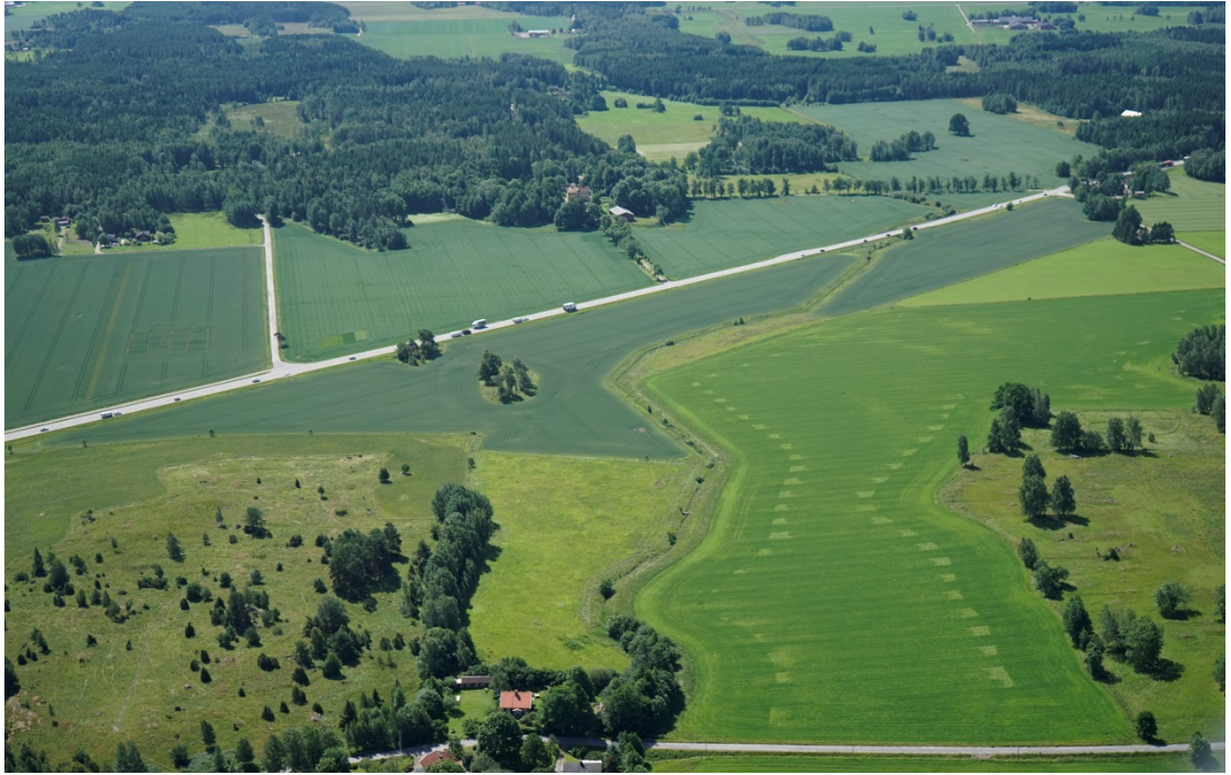
Öppet odlingslandskap kring E20 vid Berga - Ingarud