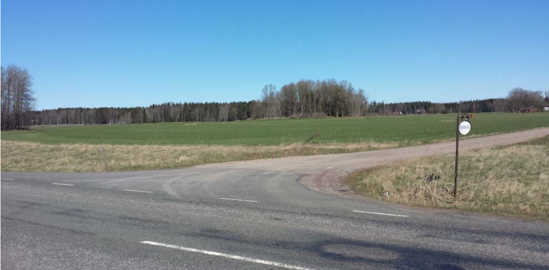
Från väg 202 - öppet landskapsrum med åkerholmar vid Brodderud

Brodderuds gård ligger mitt i ett stort avgränsat landskapsrum direkt öster om Mariestad. När man färdas utmed E20 från söder är landskapet vidöppet vid passage av Tidån. Därefter stiger terrängen och man färdas genom skogslandskap i ca fyra kilometer. Därefter öppnar landskapet upp sig till ett flackt och öppet landskapsrum kring Brodderuds gård. Området utgör ett karaktäristiskt landskapsavsnitt med flera åkerholmar.