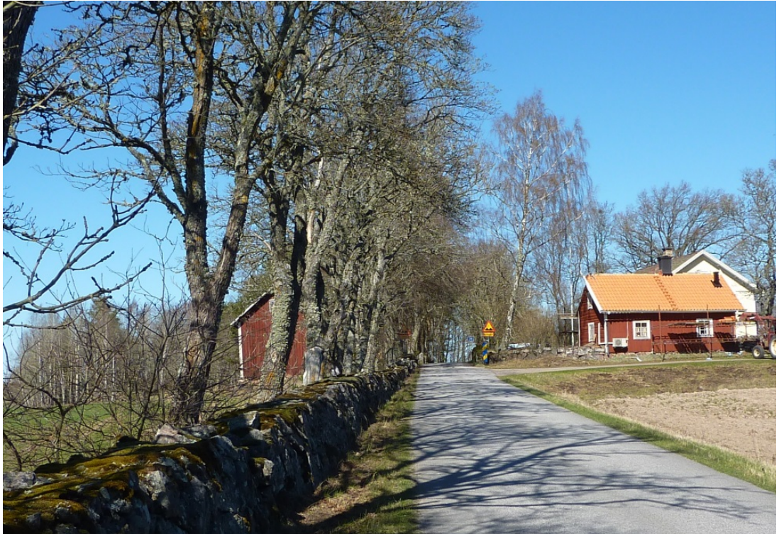
Gårdsmiljö vid Rörvägen