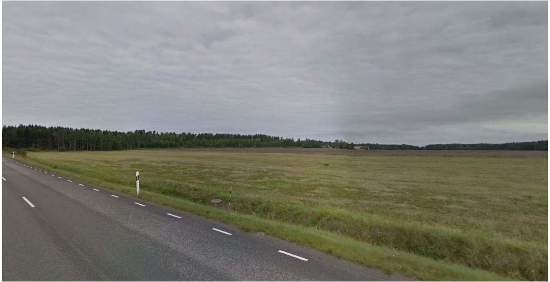
Slättområde öster om väg 2959

Slättområdet runt Brodderud avgränsas i öster av en höjdrygg vilken väg 2959 följer. Öster om väg 2959 breder ett annat slättområde ut sig i nord-sydlig riktning på båda sidor av väg 202. Området har delvis kontakt med det större slättområdet längre österut.