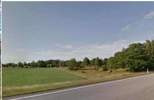
Berga sett från E20

Det är också inom dessa mer småskaliga landskapsavsnitt som man hittar äldre bebyggelsemiljöer med bevarat kulturlandskap. Flera av dessa är också utpekade av kommunen som kulturhistoriskt värdefulla miljöer. Här finns t ex kyrkbyarna Hassle och Berga. Även området kring Tjos och Fåleberg utgör gammalt kulturlandskap med äldre gårdsmiljöer och vackra betsmarker.