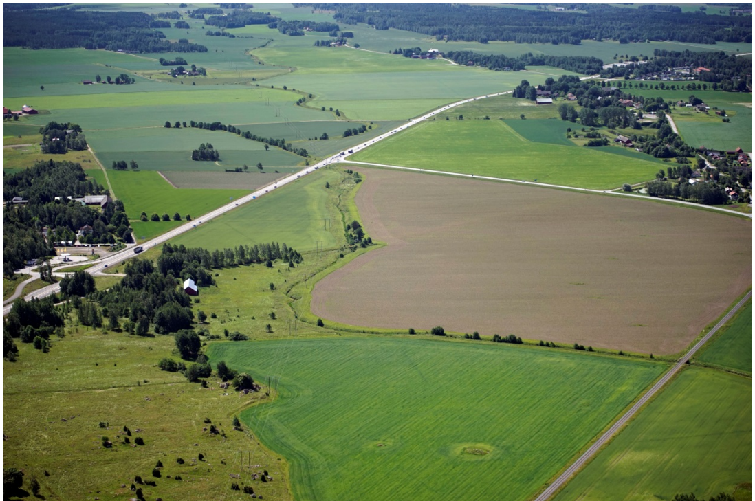
Vy över Hassleslätten vid nuvarande väganslutning väg 26

Hassleslätten och breder ut sig på ömse sidor om Hassle. Mot öster sträcker sig slätten fram till Greby backar som är en åsrygg i nord-sydlig riktning mellan Greby och Valby.