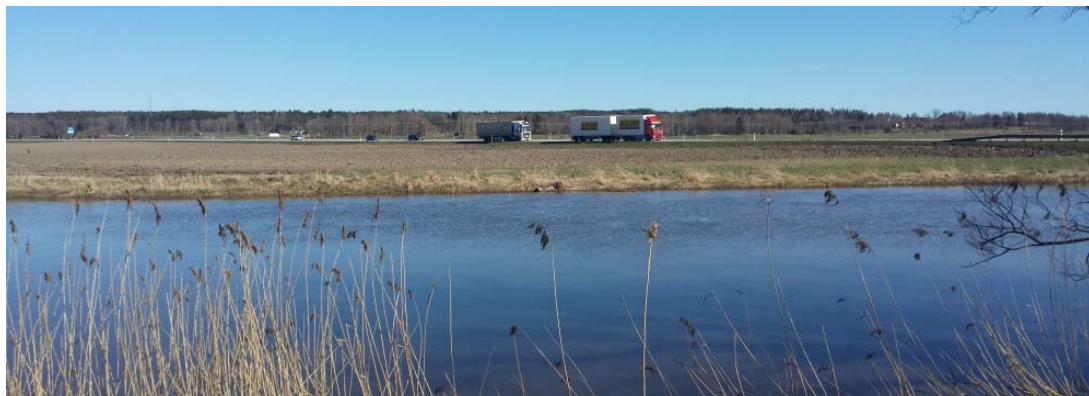
Öppet landskap vid Tidan

I det storskaliga landskapet finns landskapselement som drar blickarna till sig. Exempel på detta är kyrkorna i Hassle och Berga, ett flertal alléer vid större gårdar, äldre bebyggelsegrupper och stora solitärträd. Ett annat väl synligt inslag i landskapet är de stora kraftledningsstråken.