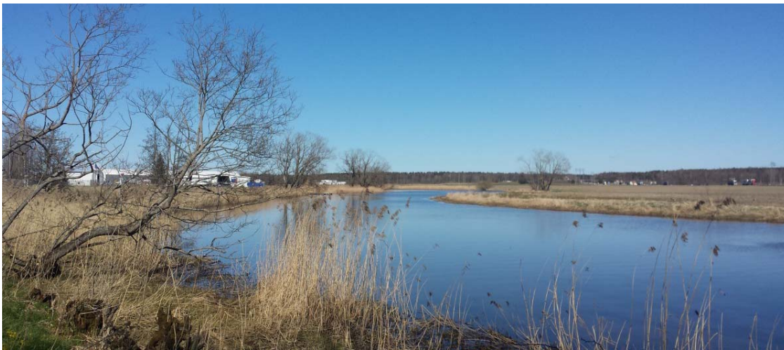
Tidan öster om Haggården